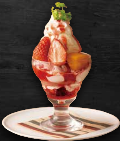
53 季節フルーツの スモールパフェ