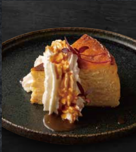
51 バスクチーズケーキ 黄金蜜酒のキャラメルソース

Basque Cheesecake with Sweet Sake Caramel Sauce