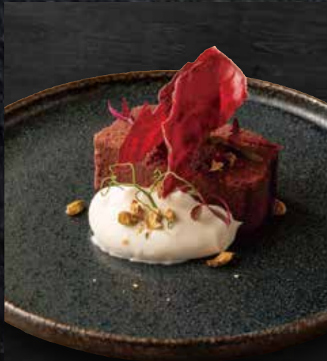
54 ビーツのガトーショコラ Beetroot Chocolate Cake