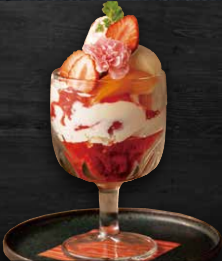
50 季節のフルーツパフェ Seasonal Fruit Parfait

【アレルギー】 ● 小麦/乳/キウイフルーツ/大豆/ りんご/ゼラチン ▲くるみ/卵/落花生/アーモンド/ マカダミアナッツ