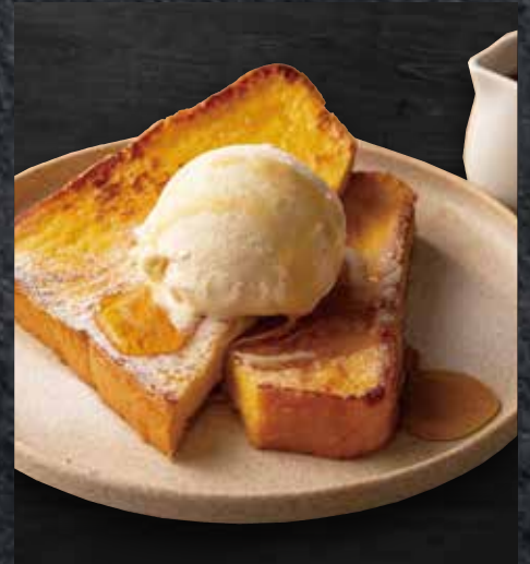
52 フレンチトースト バニラアイス添え